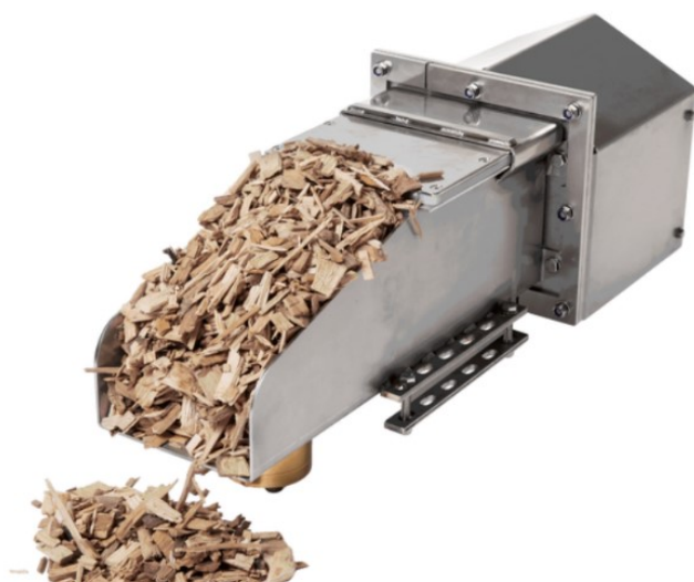
Figur 2. Eksempel på udstyr til at-line måling (her en fugttransducer). Udstyret er designet til at tage prøver i en faldende strøm med jævne mellemrum.