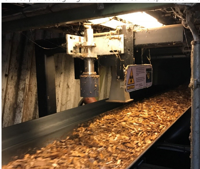
Figur 1. Eksempel på in-line målesystem: Udstyr (her baseret på MW) er placeret på transportbåndet umiddelbart før kedlerne.

Alternativt kan udstyr placeres at-line. Eksemplet i Figur 2 viser udstyr som kan tage prøver i en faldende strøm med jævne mellemrum. I dette tilfælde måles der kun på en mindre del af træflisen i forhold til in-line-metoder. Dog kan prøver tages med relativt kort mellemrum, og det vil typisk også give et retvisende billede af fugtindholdet – ved mindre der er mange, meget store variationer.