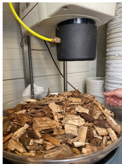
Figur 3. Eksempel på udstyr til off-line målinger (her: NIR). Prøver udtages i en separat proces og placeres derefter i prøvebakken.

En tredje mulighed er en off-line-placering. I dette tilfælde foretages prøveudtagningen typisk i en separat proces og prøverne måles derefter "manuelt" med fugtmålingsudstyret, som illustreret i Fejl! Henvisningskilde ikke fundet.Figur 3 .